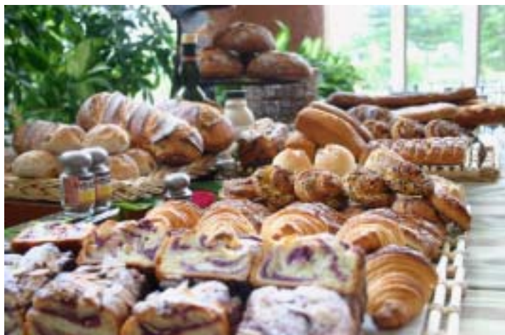
< 毎朝焼きたてのホテルメイドのパンが並ぶ >