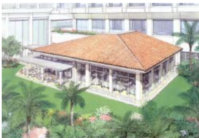
< 「クレール」外観イメージパース >