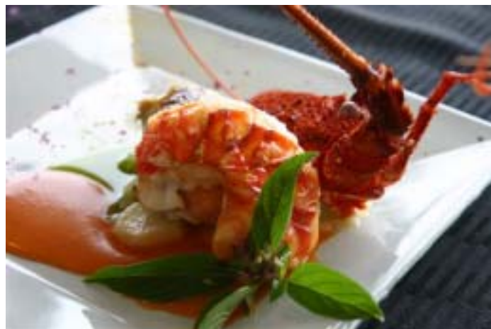
< 地元素材と自家製ハーブを使った色彩豊かな一皿(イメージ) >